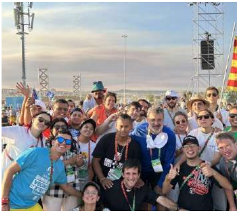
La JMJ vista des de Vic