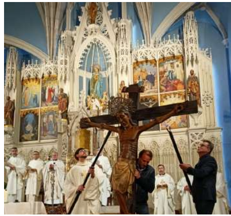
El Crist de Bormio a Bellpuig