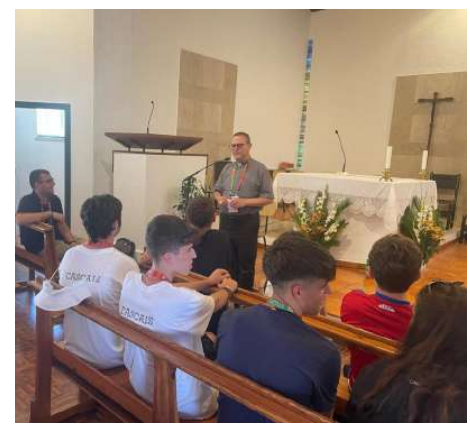
La JMJ vista des de Tortosa