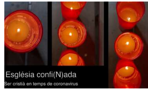
Església confi(N)ada Ser cristià en temps de coronavirus