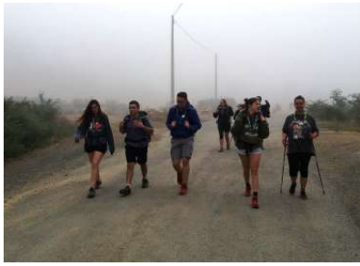
El Papa ens proposa observar alguns camins a recórrer durant l'estat de la joventut... dels anys o del cor!