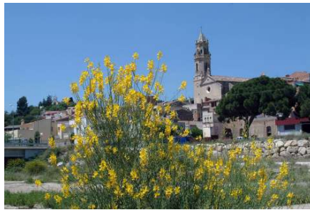
Aquests dies, tot el poble està perfumat: fa olor d'oli nou, del fruit de la olivera, signe de pau.